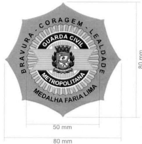
VERSO DA MEDALHA