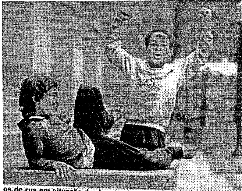
os de rua em situação de...

Dessa forma, se não é possível empregar, pelo menos vamos abrir oportunidades de trabalho, atenuando as consequências da fase econômica atual.