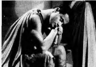
O ator na peça "Um Deus Dormiu Lá em Casa" (1949), sua estréia nos palcos

Há poucos meses, o ator passou mal durante apresentação do espetáculo "O Avarento", sua 90ª peça, e foi internado com suspeitas de problemas cardíacos.