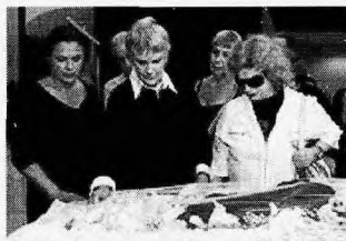
Esposa (centro) e amigos no velório na Assembleia Legislativa de SP