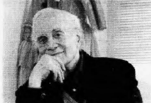
Paulo Autran (1922 - 2007)