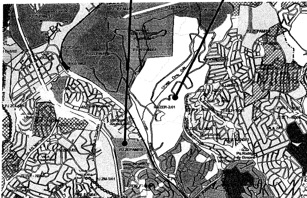
SITUAÇÃO PRETENDIDA – PJ ZM 3a/04