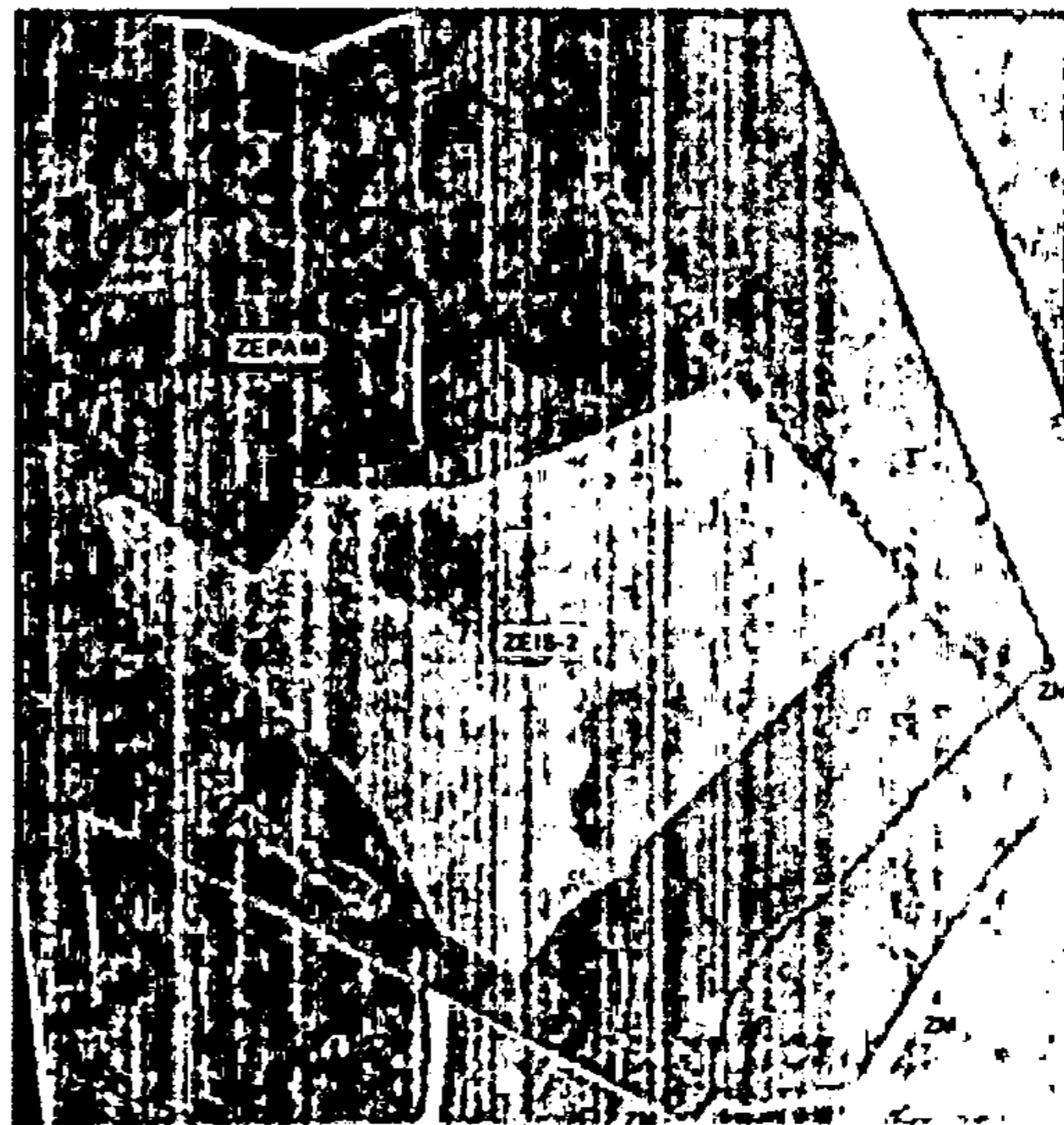
Fig 2 - Zoneamento atual da Quadra 047 a ser alterado. (GEOSAMPA).